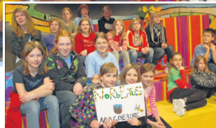
Die Norbertus-Schüler aus Magdeburg hatten Schilder gebastelt. Sie sitzen im Publikum und werden ihre fünf Wettkämpfer anfeuern.

die Lehrer das am besten entscheiden. Da haben wir auch noch nie schlechte Erfahrung gemacht“, so die Redakteurin.